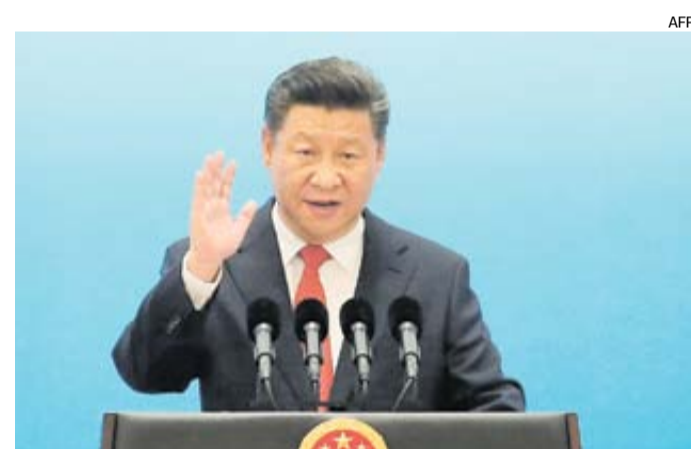
China busca mantener una tasa de crecimiento económico mediana a alta.

— China seguirá impulsando la internacionalización del yuan y la apertura gradual de la cuenta de capital, agregó el presidente de China, Xi Jinping.