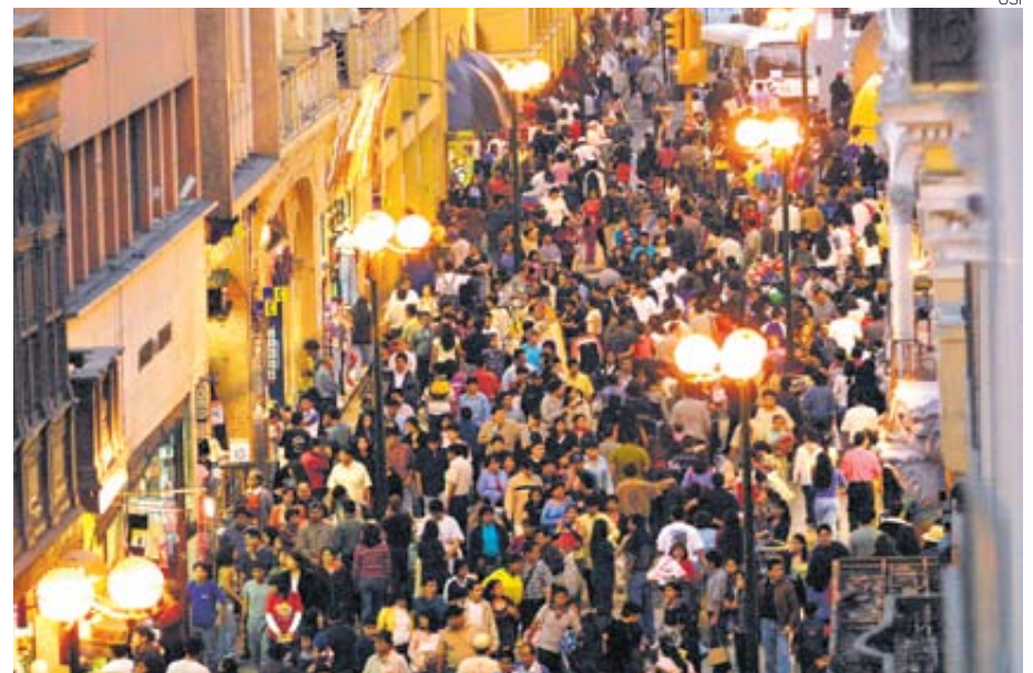
Dificultad. Eso es lo que perciben hoy los limeños para conseguir empleo.

“Espoco probable que la situación de las familias se recupere si el empleo formal no retoma tasas de crecimiento más altas”, dice informe de Apoyo Consultoría.